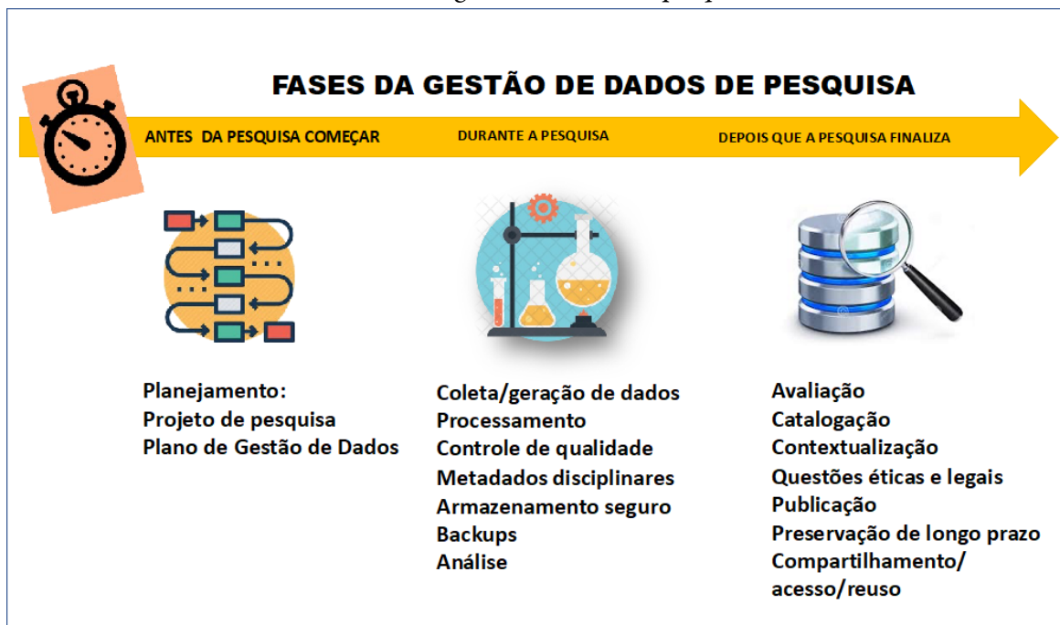
FIGURA 2 Fases da gestão de dados de pesquisa.