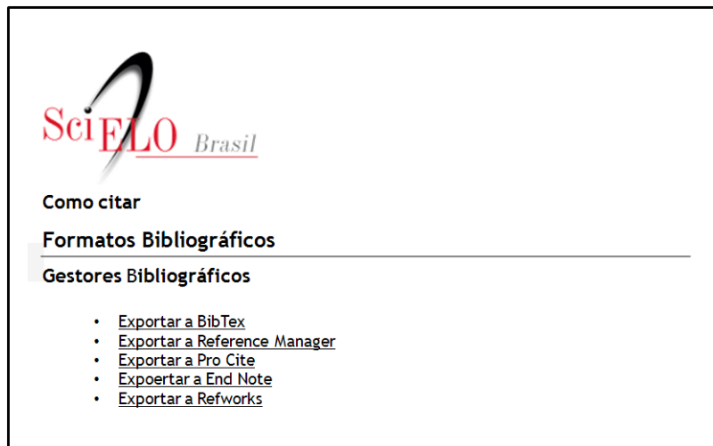
Figura 4: SciELO: Exportación de citas.

Por otro lado, SciELO también posibilita la exportación de citas en distintos tipos de gestores bibliográficos (Figura 4).