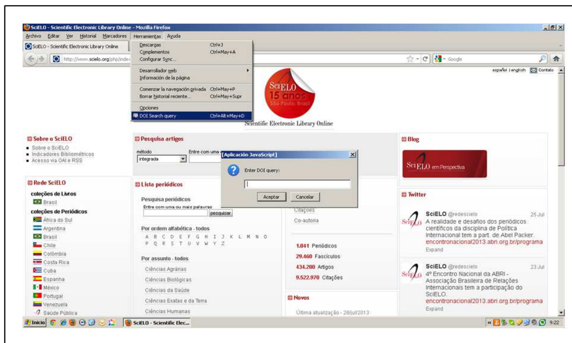
Figura 3: DOI Search.