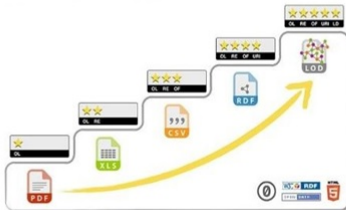
Figura 1 – Ranking “5 estrellas” para publicación y conexión de datos

Berners-Lee (2006) ha compilado el ranking de 5-star Linked Open Data para la evaluación de los datos publicados. La vista de ranking se muestra en la figura 1.